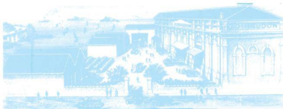
L'USINE EN 1890